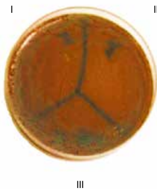
Рис. 1. Чашка Петри с нанесенной культурой S. aureus и коллоидными растворами наночастиц серебра. Сектор I – наночастицы серебра с концентрацией 50 мг/л, сектор II – наночастицы серебра с концентрацией 100 мг/л, сектор III – контроль